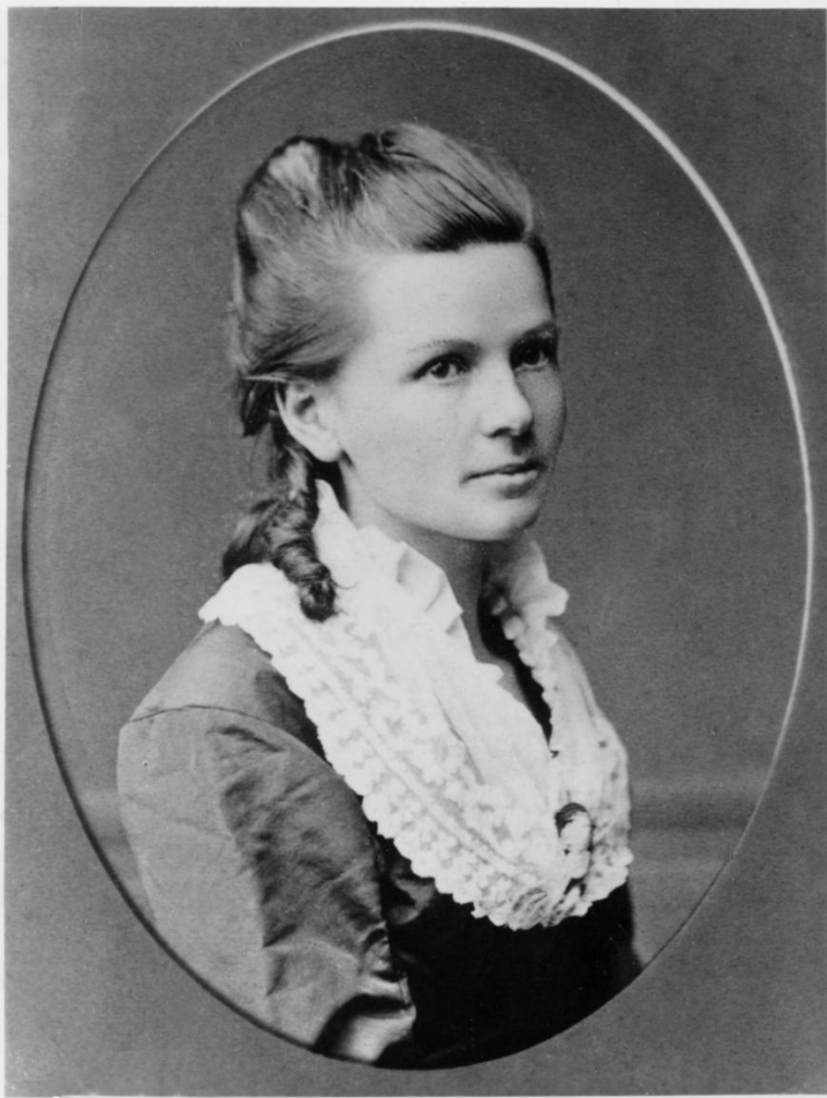
ベルタ・ベンツ(1849年5月3日生 – 1944年5月5日没)